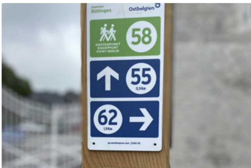
Un sentier de grande randonnée, de haut qualité, inauguré dans les cantons de l'Est

La Ventrilogie, un sentier de grand randonnée, d'une longueur de 109 kilomètres a été inauguré mardi à Raeren, en Communauté germanophone.