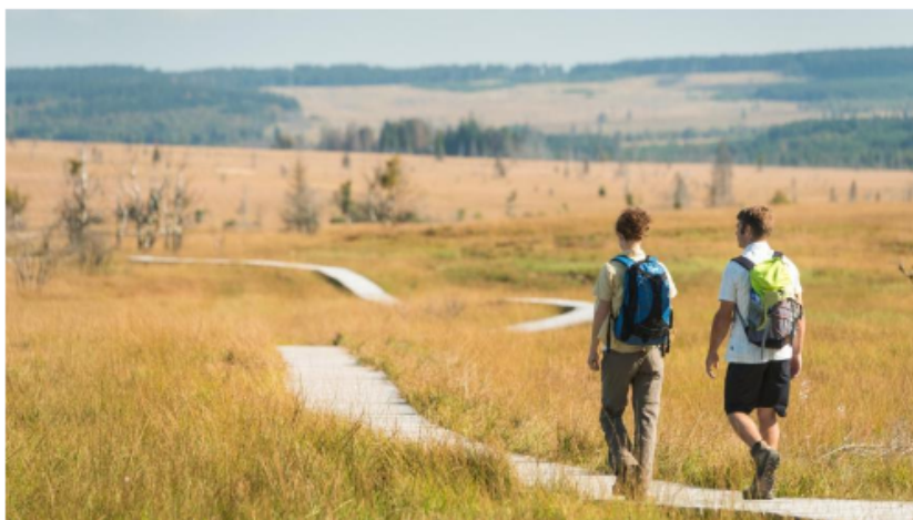
Deux étapes de ce sentier concernent les Hautes Fagnes. - ostbelgien.eu

La Venntriologie, un sentier de grande randonnée, d'une longueur de 109 kilomètres a été inauguré mardi. Il sillonne l'Est du pays du nord au sud, des Trois frontières, jusqu'à Bütgenbach, pour faire découvrir la richesse des paysages des cantons de l'est.