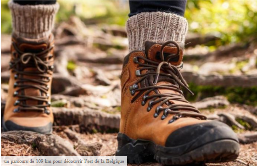
un parcours de 109 km pour découvrir l'est de la Belgique

--- Avis aux amateurs de longues balades. Fin août, un itinéraire de randonnée de 109 kilomètres a été inauguré dans l'est du pays. La « Venntrologie » relie les Fagnes à l'Eifelsteig allemand.