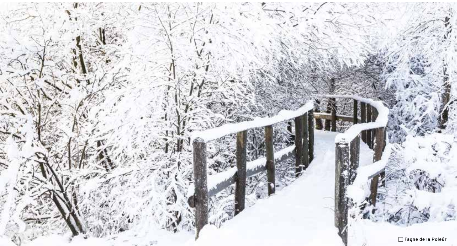
□ Fagne de la Poleür

Ein Leben ist nicht genug, um alle Winkel des Venns zu entdecken und den Reiz der unberührten Landschaft des Hohen Venns so richtig zu verstehen. Deshalb sollten alle Naturfreunde und Wanderfans auf ausgedehnten Wanderungen ein Stück Unendlichkeit der Moorlandschaft, die Mystik einer jahrtausendealten Wildnis und all ihren Schönheiten verinnerlichen. Los geht's!