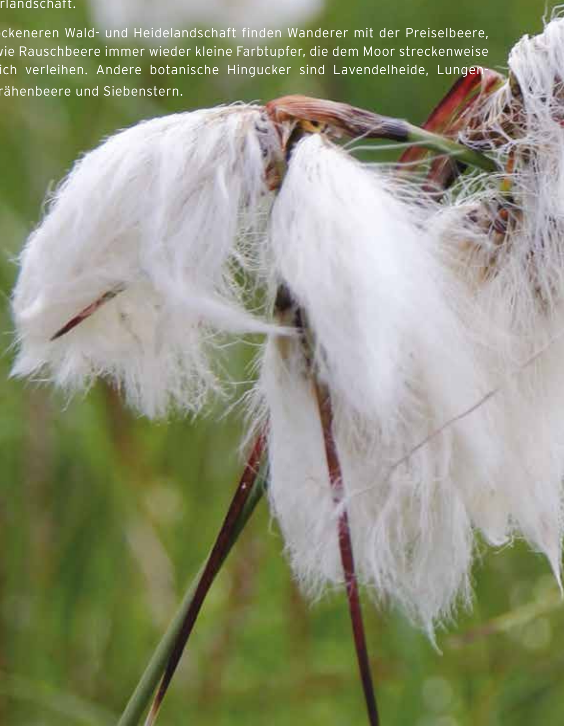
□ Schmalblättriges Wollgras

Und auch in der trockeneren Wald- und Heidelandschaft finden Wanderer mit der Preiselbeere, der Heidelbeere sowie Rauschbeere immer wieder kleine Farbtupfer, die dem Moor streckenweise einen neuen Anstrich verleihen. Andere botanische Hingucker sind Lavendelheide, Lungen-Enzian, Schwarze Krähenbeere und Siebenstern.